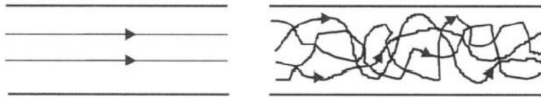
Rys. 2. Tory ruchu cząsteczek w ruchu a) laminarnym, b) burzliwym

Wielkością charakterystyczną służącą do rozdzielenia ruchu jest liczba Reynoldsa, wyznaczana z zależności: